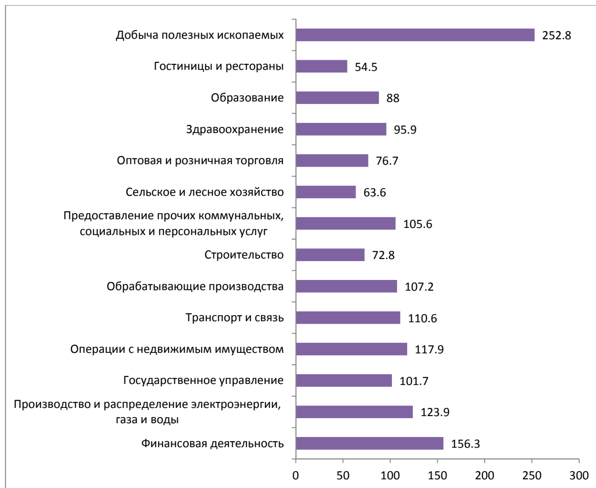
РИСУНОК 2. Межотраслевая дифференциация средней заработной платы в апреле 2016 г. в Санкт-Петербурге, в % к среднему уровню (средняя заработная плата = 100%)