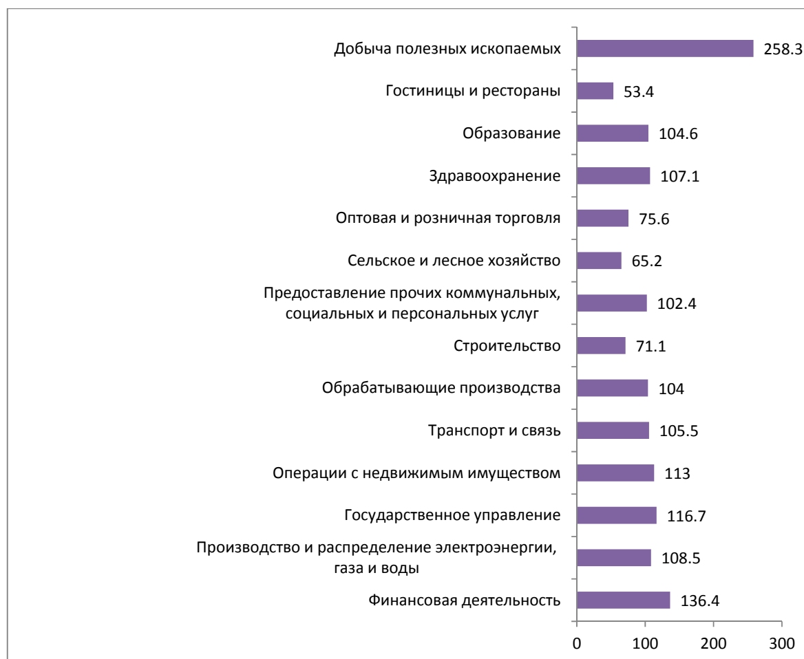
РИСУНОК 2. Межотраслевая дифференциация средней заработной платы в июне 2016 г. в Санкт-Петербурге, в % к среднему уровню (средняя заработная плата = 100%)