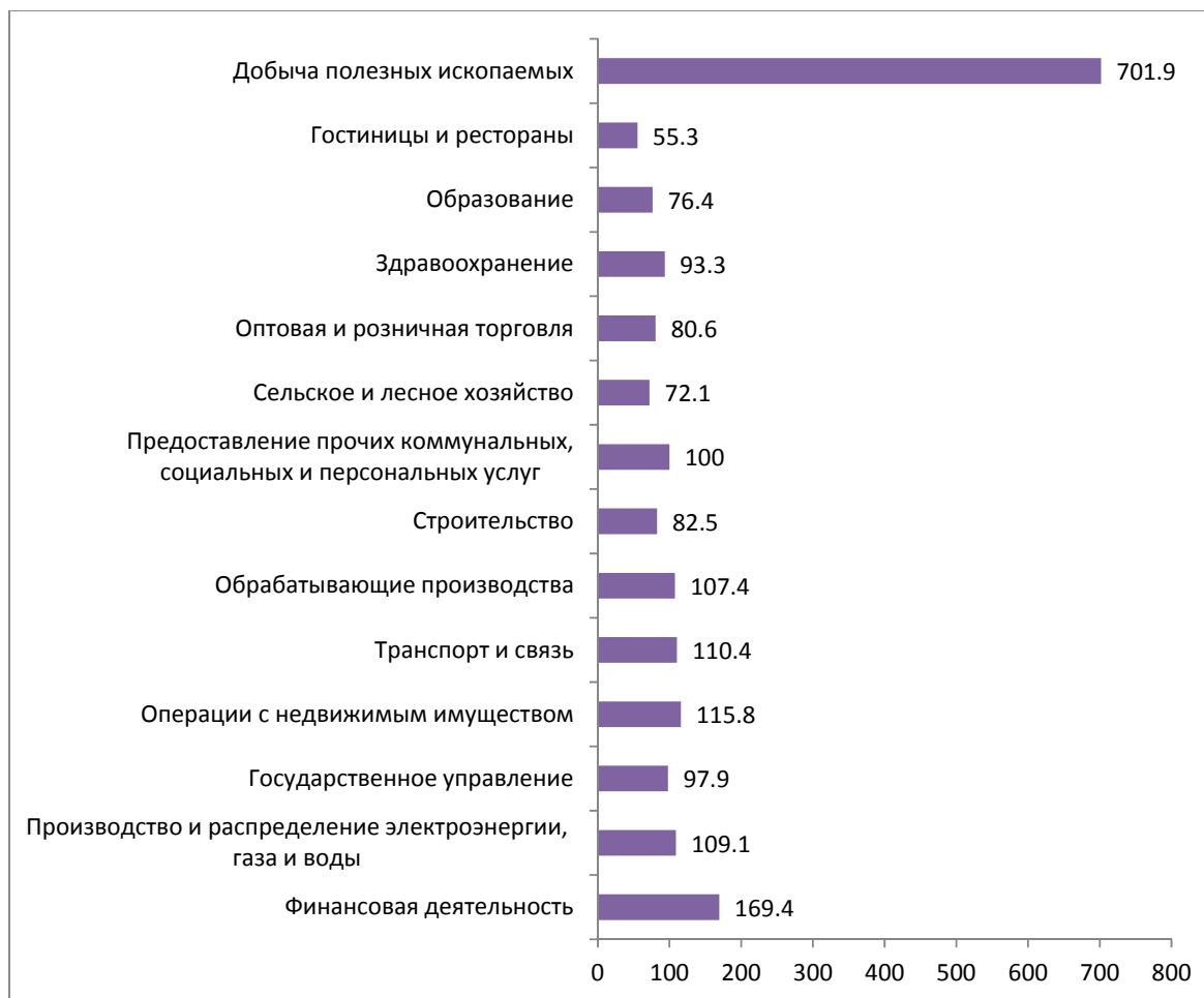
РИСУНОК 2. Межотраслевая дифференциация средней заработной платы в августе 2016 г. в Санкт-Петербурге, в % к среднему уровню (средняя заработная плата = 100%)