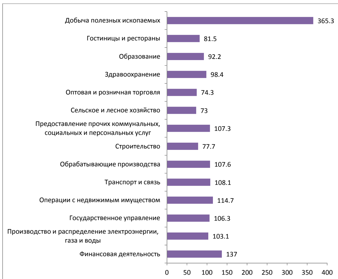
РИСУНОК 2. Межотраслевая дифференциация средней заработной платы в октябре 2016 г. в Санкт-Петербурге, в % к среднему уровню (средняя заработная плата = 100%)