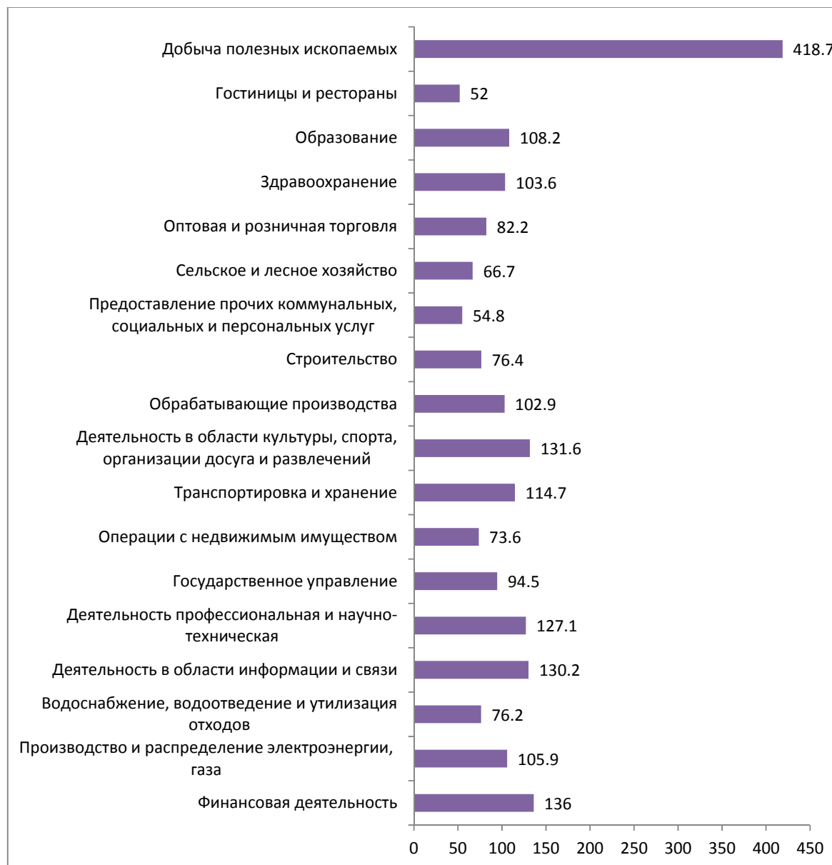
РИСУНОК 2. Межотраслевая дифференциация средней заработной платы в июне 2017 г. в Санкт-Петербурге, в % к среднему уровню (средняя заработная плата = 100%)