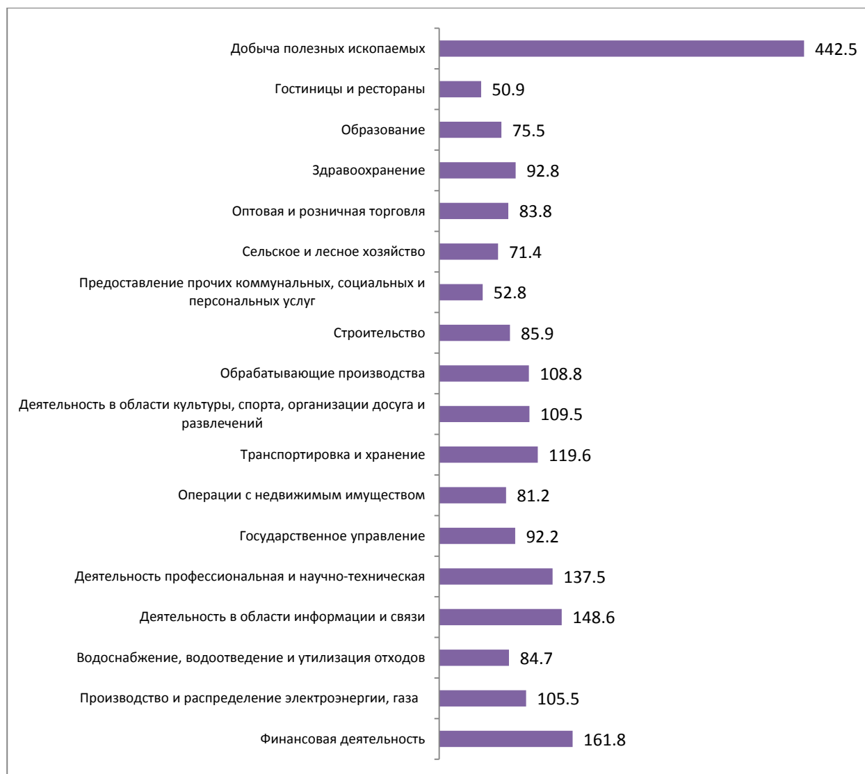
РИСУНОК 2. Межотраслевая дифференциация средней заработной платы в августе 2017 г. в Санкт-Петербурге, в % к среднему уровню (средняя заработная плата = 100%)