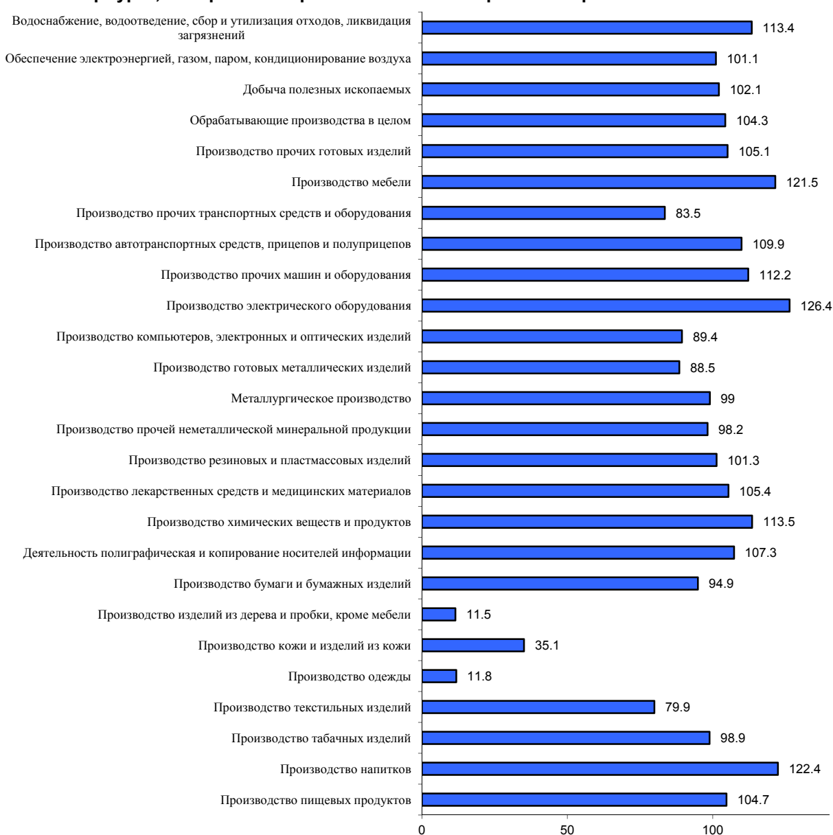
РИСУНОК 3 Динамика объема производства продукции по отраслям промышленности в Санкт-Петербурге, январь-сентябрь 2018 г. в % к январю-сентябрю 2017 г.

Компания «ТР-инжиниринг» запустила производство высокопрочной проволоки для строительной отрасли. Сетки из подобных материалов, производимые по японской технологии используются при сооружении автомобильных и железнодорожных тоннелей. Это второе предприятие, открытое на территории Особой экономической зоны Санкт-Петербурга в 2018 г. До конца года планируется открыть еще три производства. Всего в ОЭЗ зарегистрировано 49 резидентов с общим объемом заявленных инвестиций 69 млрд. руб.