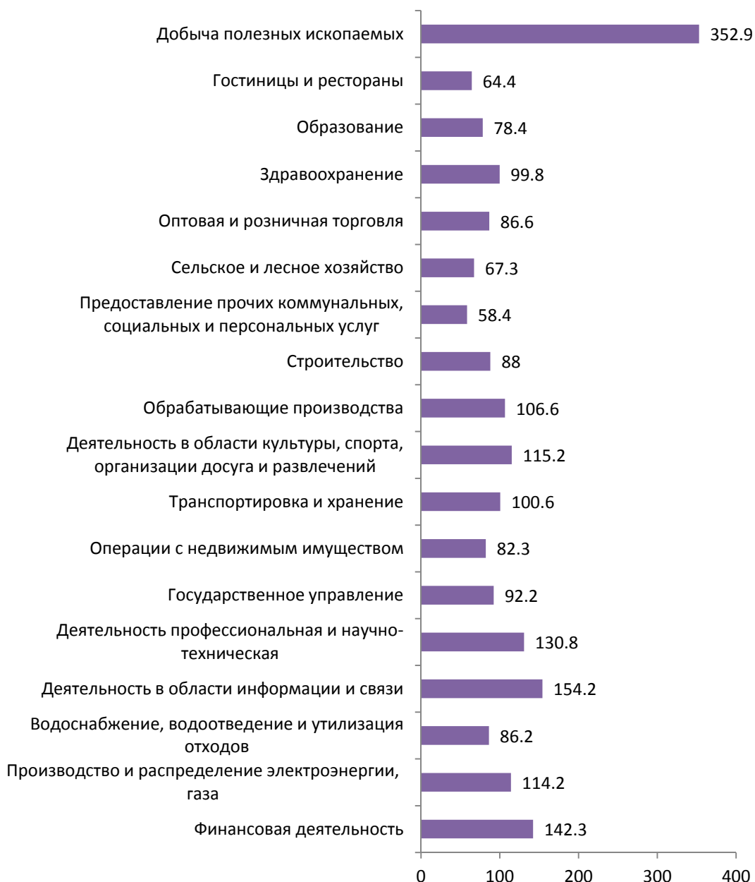
РИСУНОК 2. Межотраслевая дифференциация средней заработной платы в августе 2018 г. в Санкт-Петербурге, в % к среднему уровню (средняя заработная плата = 100%)

А наиболее низкая заработная плата выплачивалась занятым в гостиницах и ресторанах (64,4% от средней зарплаты), предоставлении прочих услуг (58,4% от средней зарплаты).