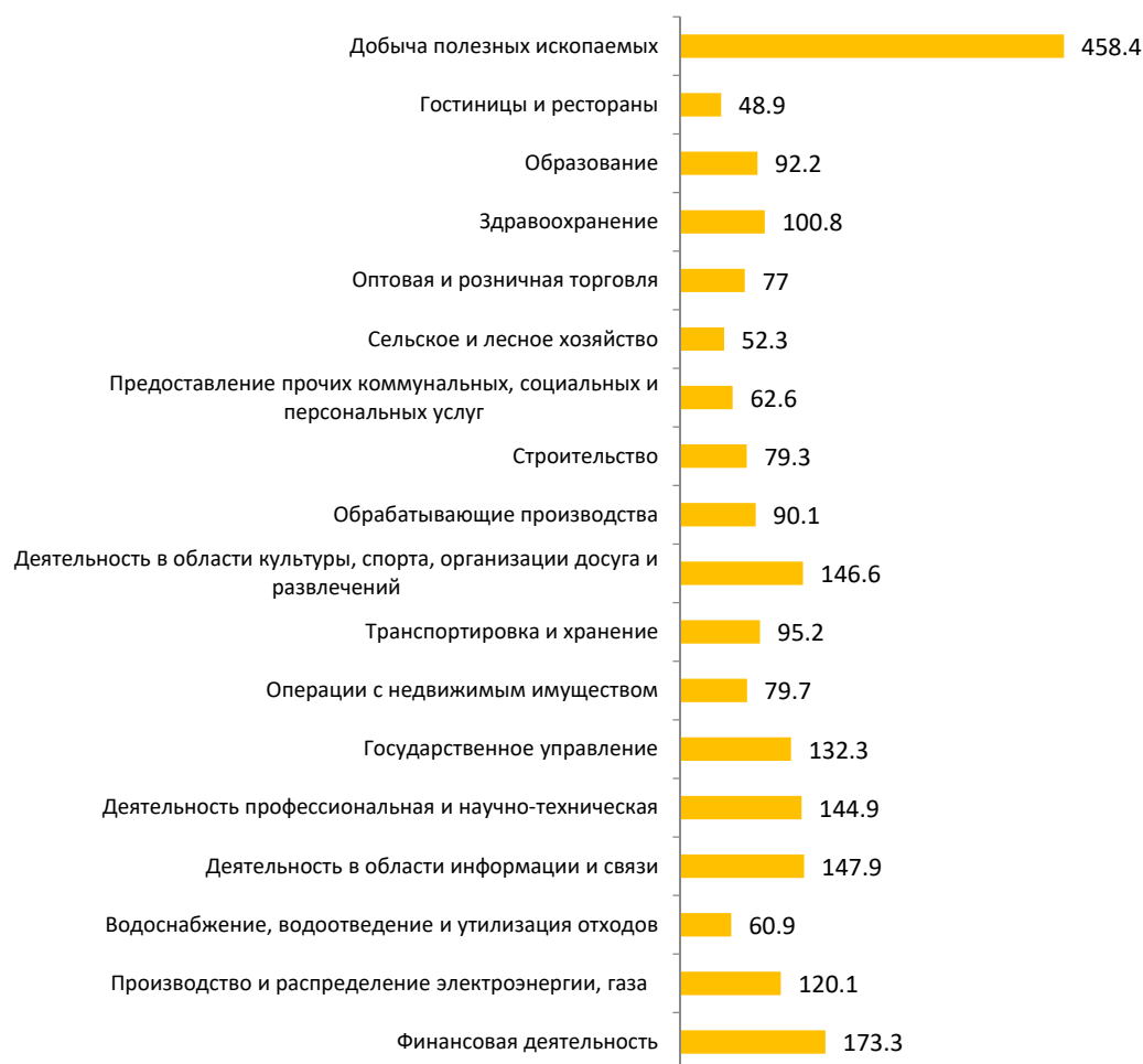
РИСУНОК 2. Межотраслевая дифференциация средней заработной платы в декабре 2019 г. в Санкт-Петербурге, в % к среднему уровню (средняя заработная плата = 100%)

На Средне-Невском судостроительном заводе (входит в Объединенную судостроительную корпорацию) 29 января 2020 г. спущен на воду корабль противоминной обороны «Яков Баляев» проекта 12700 «Александрит». Корабль был заложен в декабре 2017 г., это четвертый корабль в линейке проекта 12700 «Александрит». Головной корабль серии