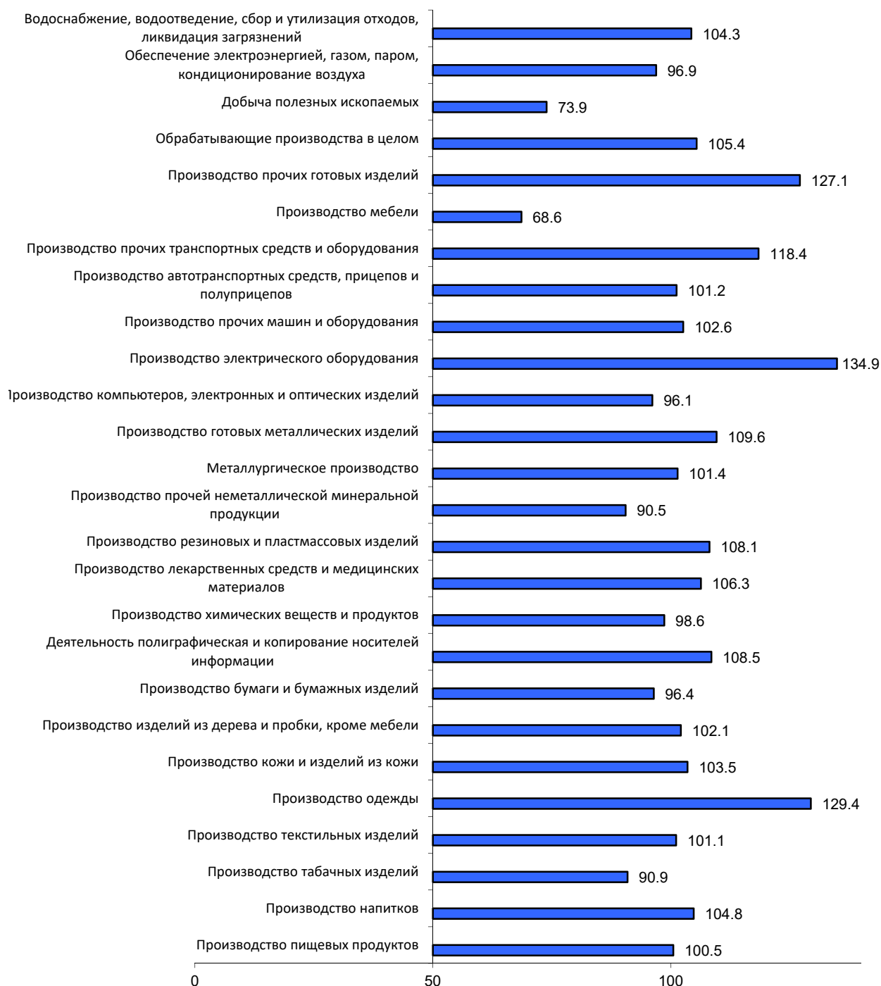
РИСУНОК 3 Динамика объема производства продукции по отраслям промышленности в Санкт-Петербурге, январь-декабрь 2020 г. в % к январю-декабрю 2019 г.