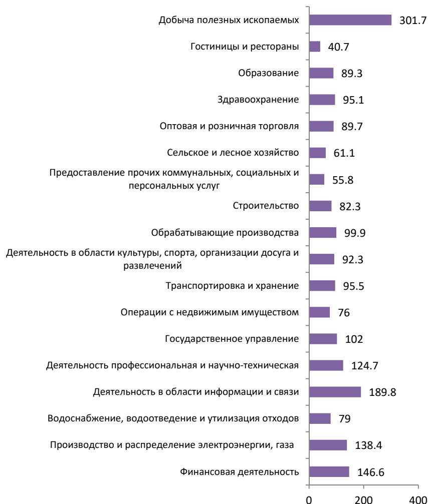
РИСУНОК 2. Межотраслевая дифференциация средней заработной платы в апреле 2020 г. в Санкт-Петербурге, в % к среднему уровню (средняя заработная плата = 100%)

персональных услуг (55,8% от средней заработной платы) и сельском хозяйстве (61,1% от средней заработной платы).