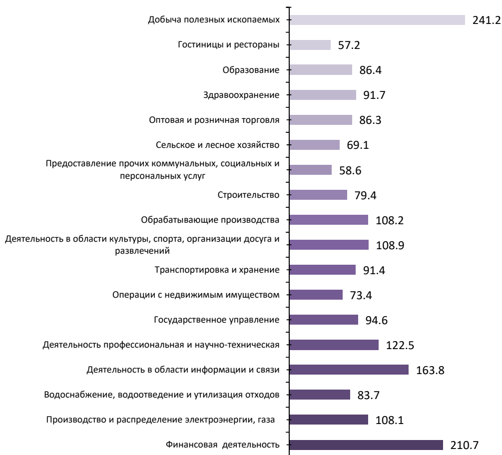
РИСУНОК 4. Межотраслевая дифференциация средней заработной платы в марте 2024 г. в Санкт-Петербурге, в % к среднему уровню (средняя заработная плата = 100%)