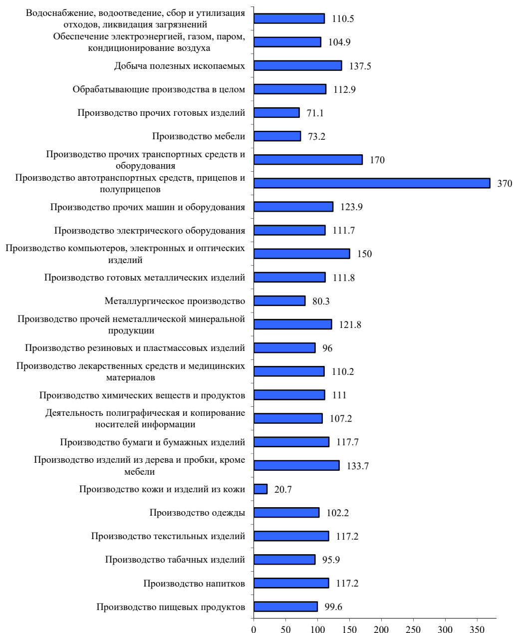
РИСУНОК 5. Индекс промышленного производства по отраслям, январь-апрель 2024 г. к январю-апрелю 2023 г.

В Санкт-Петербурге на территории промзоны «Арсенал» открылся новый завод «Объединенной производственной компании — Восход» («ОПК-Восход»), который займётся серийным выпуском полимерных фитингов с закладными нагревателями.