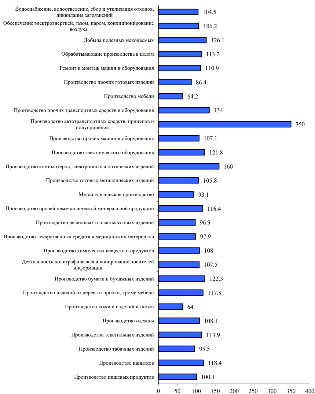
РИСУНОК 4. Индекс промышленного производства по отраслям, январь-июль 2024 г. к январю-июлю 2023 г.

Проект 04710 «Соммерс» был разработан петербургским проектно-конструкторским бюро «Форсс Технологии» по заказу «Невы Тревел». Суда этой серии будут осуществлять перевозки в акватории фортов Кронштадта и доставлять пассажиров к полностью изолированным от берега фортам «Кроншлот» и «Император Александр Первый», которые в рамках проекта «Остров фортов» к 2026 г. будут отреставрированы и открыты для посещения.