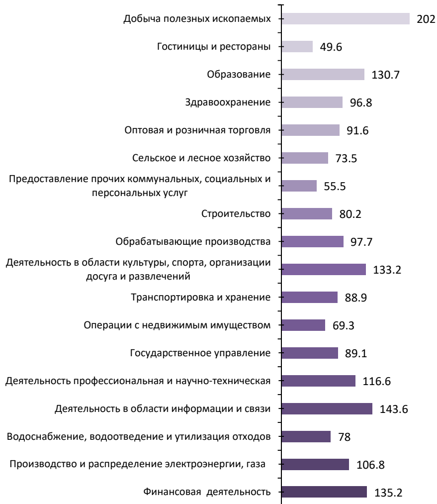
РИСУНОК 3. Межотраслевая дифференциация средней заработной платы в марте 2024 г. в Санкт-Петербурге, в % к среднему уровню (средняя заработная плата = 100%)