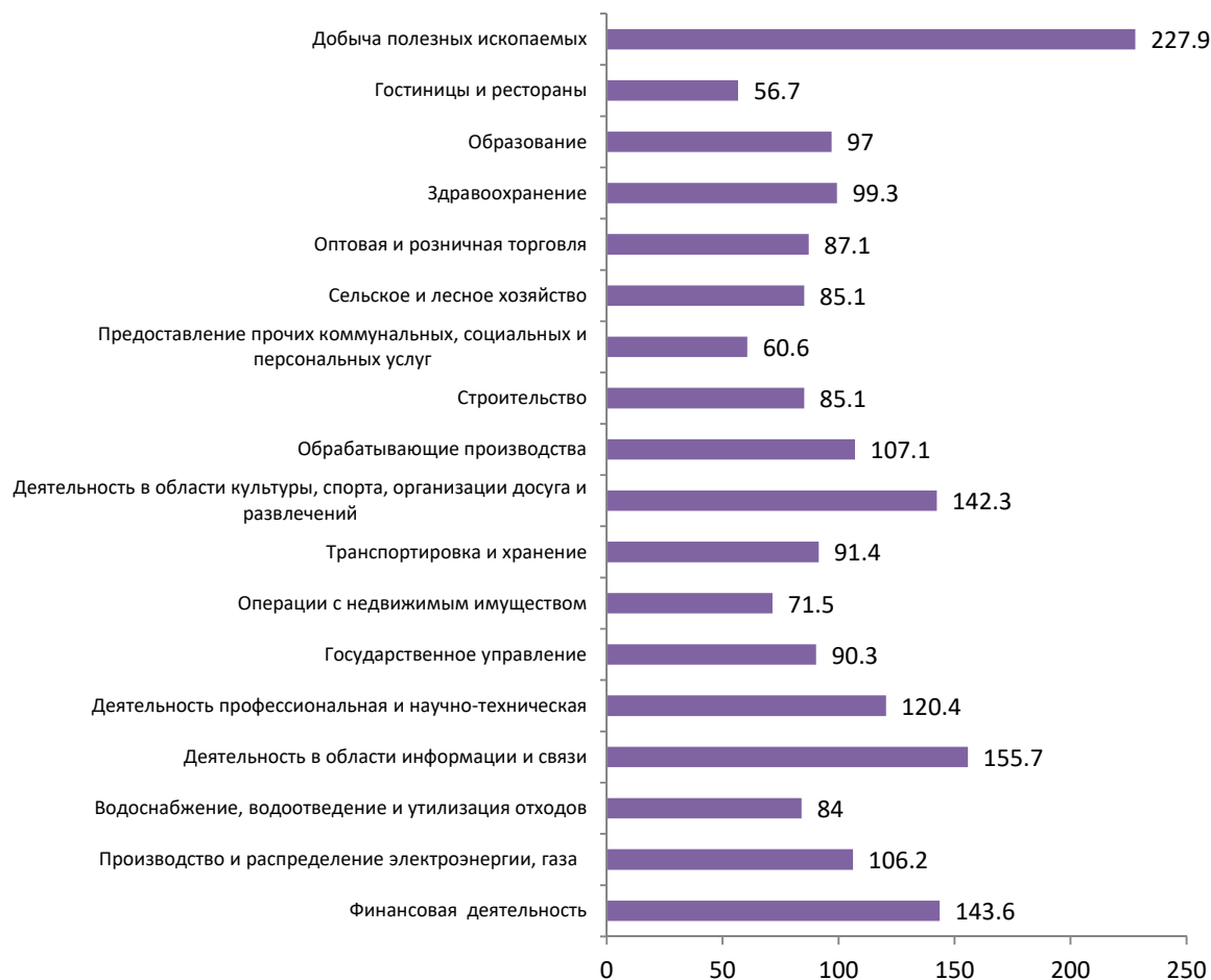
РИСУНОК 3. Межотраслевая дифференциация средней заработной платы в сентябре 2024 г. в Санкт-Петербурге, в % к среднему уровню (средняя заработная плата = 100%)