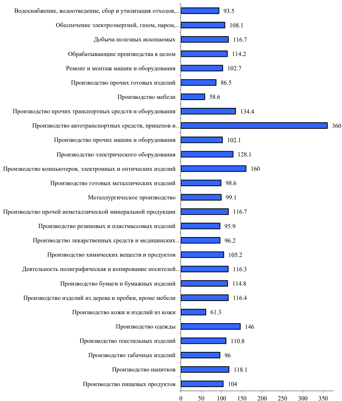
РИСУНОК 4. Индекс промышленного производства по отраслям, январь-октябрь 2024 г. к январю-октябрю 2023 г.

пружинными подвесками. Почти вся конструкция российская. Бывшую площадку Scania-MAN переименовали в завод «Романов», учредители его не раскрываются. В будущем планируется выпуск целого семейства полноприводных грузовиков с количеством осей от двух до четырех ( https://news.drom.ru 12.11.2024).