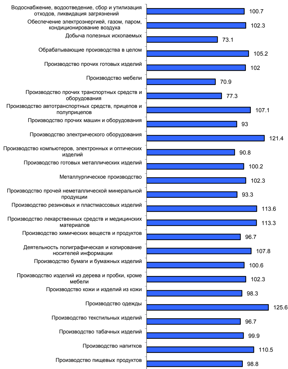
РИСУНОК 3 Динамика объема производства продукции по отраслям промышленности в Санкт-Петербурге, январь-май 2019 г. в % к январю-маю 2018 г.

ставила 24,5%, что на 0,4% выше, чем годом ранее ( https://dvizhok.su , 24 июня 2019 г.).