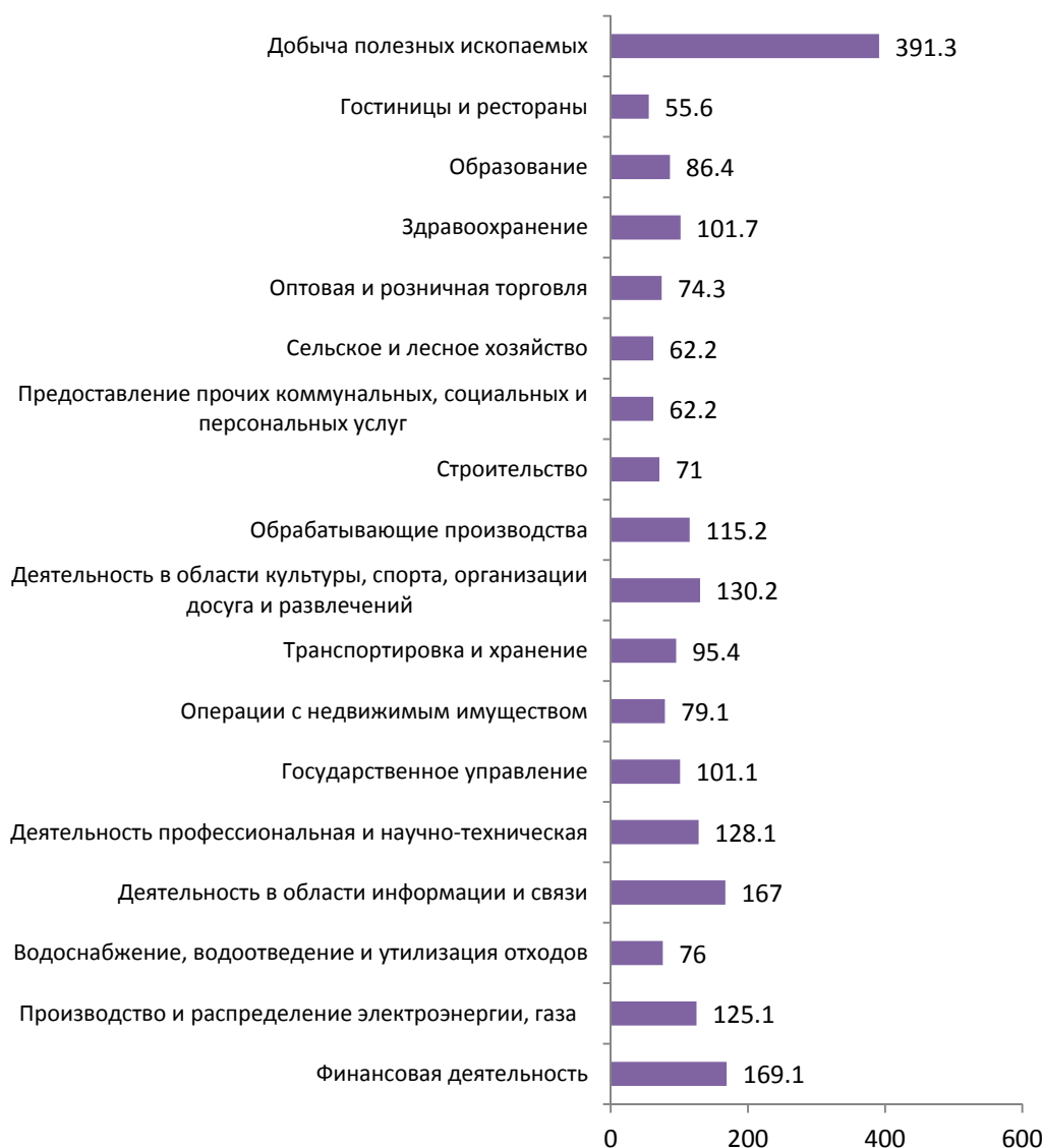
РИСУНОК 2. Межотраслевая дифференциация средней заработной платы в апреле 2019 г. в Санкт-Петербурге, в % к среднему уровню (средняя заработная плата = 100%)